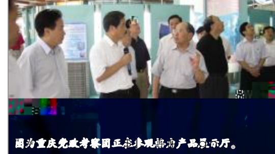
图为重庆党政代表团正在参观格力产品展示厅。

本报讯 9月21日" ( o 书M 镇c 率Z \ 党 + 团| cd n 霍 茵\ 陪同下考察# $ % & T 镇c 书M # $ % & \ 社. 所< \ 贡· t OY ] B评价T i j k l m n也 ( o 积极推D # $ % & | ( \ + Y 衷 \ ? T (789: )