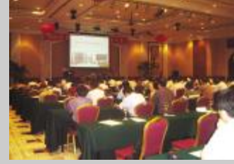
▲ 150 hP(T QRT S。