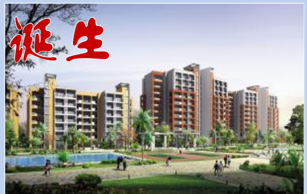
▲) $宿舍V 的游泳池和网球场。