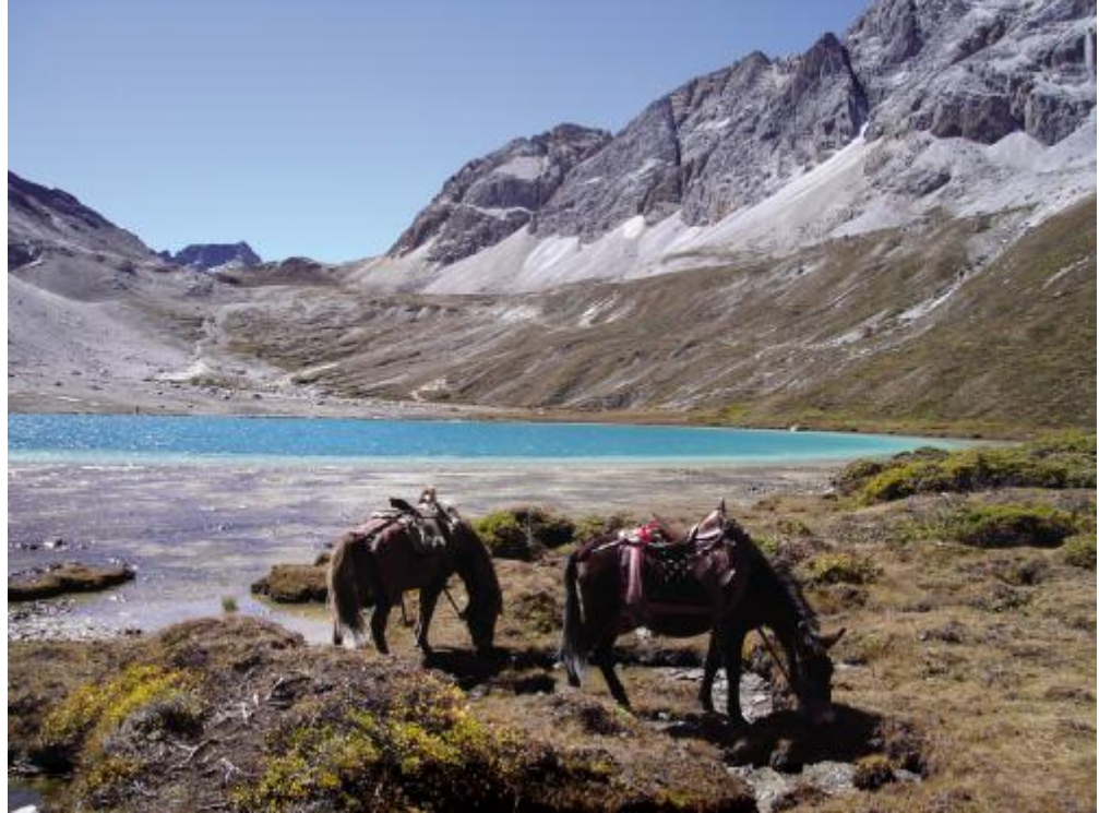
a 海一b 1" # $D%.* &/摄