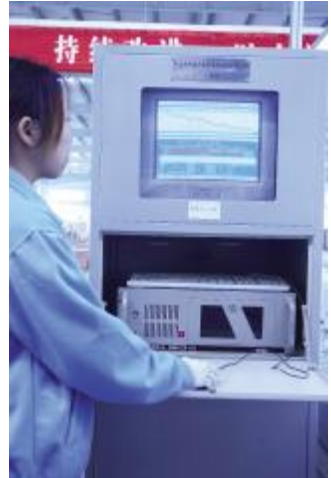
▲ 领先 自 化 脑检测设备