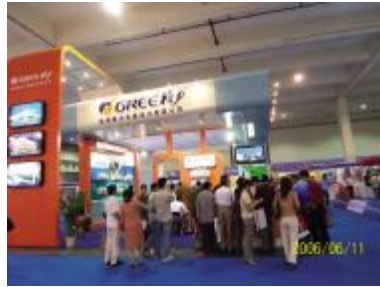
▲格力电器在中国节博会上备受青睐

格力空调在展会期间展示了其最新的节能空调产品，吸引了众多参观者驻足观看。格力空调负责人表示，格力空调一直致力于研发节能、环保的空调产品，以满足广大消费者的需求。