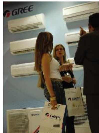
▲ 美 户纷纷在格力展 足欣赏