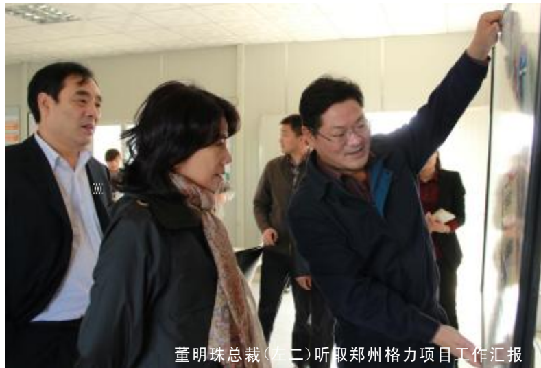
董明珠总裁(左二)听取郑州格力项目工作汇报

其中格力电器在2010年海业收入92.91亿元，F增长61.78%，F500强平%水平D出8个百分点。在上榜企业中，有182H企业申了并P组行为，共并P组了1112H企业，一些地；国有企业过兼并P组入500强。