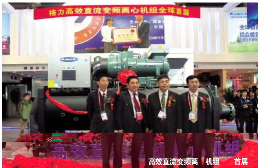
高效直流变频离心机组 首展

(上接 )在格力展位可以看到,特意前来格力展位参观、洽谈的国内外观众、客户络绎不绝。他们对格力带来的高效直流变频离心机组、GMV5全直流变频多联机组、盐水螺杆式液体冷却机组、格力GIMS智能管理系统、直流变频多联空调热水机组、R290新冷媒应用、物联网空调、空气能热水器等核心技术产品表示出了浓厚的兴