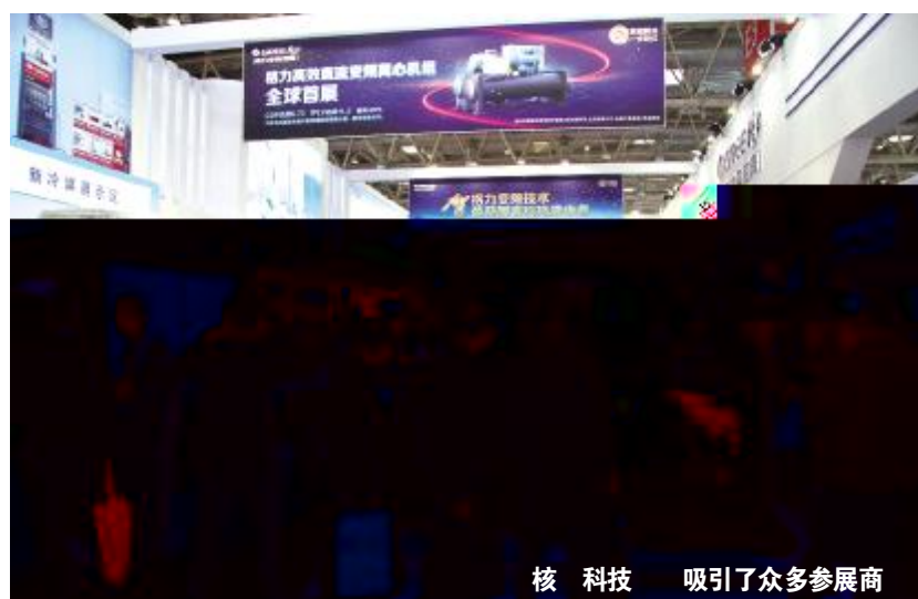
核科技 吸引了众多参展商

专家预计,未来国内中央空调市场仍将以年均约20%的速度增长,在品牌格局和产品格局愈发成熟的背景下,格力中央空调凭借强大的产品竞争力,必将迎来更加强势的发展。