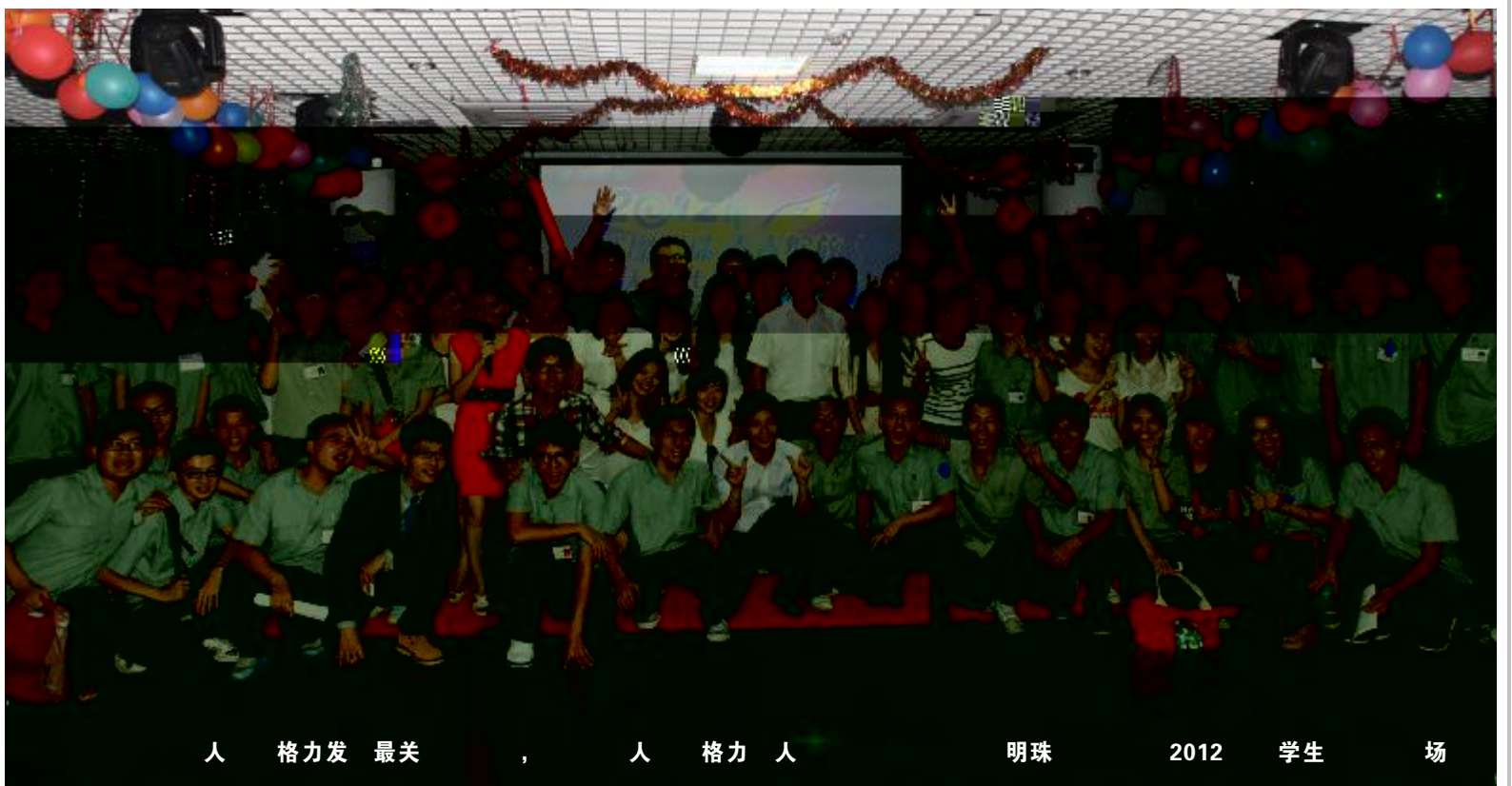
人 格力发 最关 , 人 格力 人 明珠 2012 学生 场

= $/ . / O1) 经济2), $公司继续314主# < $5I 发6公司作为空调行业89n业7有) q < . 8G布局、规模化,) 成q·) 9: ; < X·) 、全q业=) ·) 、品> 品牌·) $继续深化) ? 化@A $BCD@EF· 化、, G$加大4主品牌- H力P$! %dG升公司%&J利<力N 国K证券LM员NOPQRS$/ 家电行业%&uYPTU, V) rs , $格力电器" 半年收入K$利 增3 L- 2vWF$&. a公司| } ·) 1 续X大N r Yn业家/ ZST[ 庆\ QR S$] a格力电器半年业绩报表$ 半年 ] - ^外x年冲_ 1000亿` a] 大N