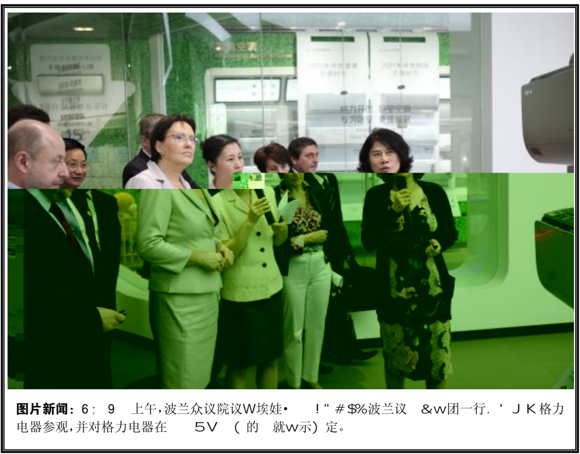
图片新闻：6月9日上午，波兰众议院议W埃娃· !"# $%波兰议 &w团一行。 ' J K 格力 电器参观，并对格力电器在 5V ( 的 就w示)定。

在行业Ha中•• 。超低温 数码 联 组、， +>? 离心 S 组、!" 暖户 中央 空调、1<=>? 空调、R290 pST空调、双级>? 压缩 一NO 国 产品， 填 补行业空白， 写空调行业 历史。 格力 "王 双级>? 空 调、- 双级增焓转子 >? 压 缩 ' 彻底颠覆 传统空调 的行 极{，在 -30℃ 54℃ 中均" E 常行。 在中央空调的w 上，格力 电器H样 。格力， +>? 离 心 聚n中央空调研 ( 的 最V ' 果， 组IPLV达 11.68，比 离心 S 组 节" 40%- 上，是 最节" 的 大型中央空调。