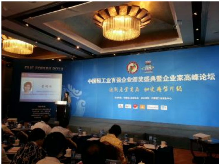
本报讯 6月21日，由中国轻工业联合会、中国轻工业百强企业颁奖典礼暨企业家高峰论坛...

五大分 - n 。格力电器：E；级企业Q< - n企业综合：n。中国+2业联合 2011年度=，在中国+2业行业十n企业评价2 上，j 中国+2业- n企业综合评价2 。+2- n评价> 企业主 业 ?入、6@i A、产值6@率、B?占6B比重和2业i 产值增 5个：标行综合评分， 注重企业模 ， C顾企业56 、价值56" 力、对 89及 W性 综合性：标，n调企业的均D ，" E 、uF ] G企业的Ha力 。 2012年受国 金I J ， 需求KL，空调行业 M为 显的 N。 格力