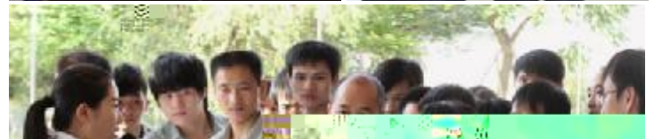
讲解员演示净水机过滤后的效果