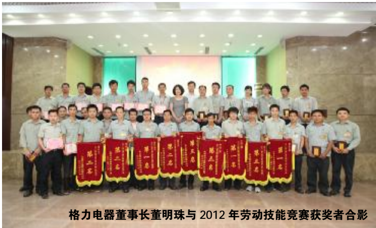
格力电器董事长董明珠与 2012 年劳动技能竞赛获奖者合影

本报讯 格力电器一 / 一的动技能竞: 于 8 月 20 日; l < 幕, 格力电器董事长董明珠在 = 动 > 4 上发表