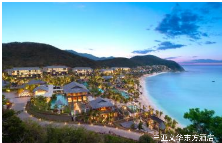
三亚文华东方酒店

！" 日，海u格力 驻该wx，成 中央空调民 销售公&成功与三v文华东 •品牌 驻世界|级wx 9} wx y z了中央空调采_合 同，格力直{变频离心机 将 的F /工程。