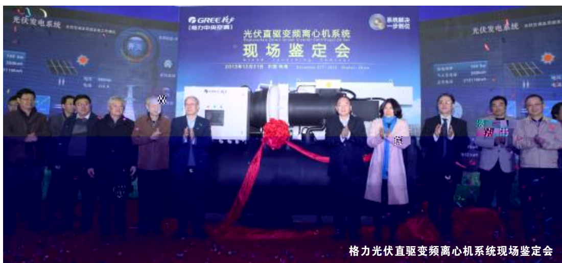
格力光伏直驱变频离心机系统现场鉴定会

本报讯 12月21日,格力电器在珠海举行技术鉴定会,其自主研发的“光伏直驱变频离心机系统”被专家组一致认定为“国际领先”。