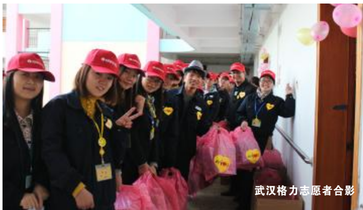
武汉格力志愿者合影