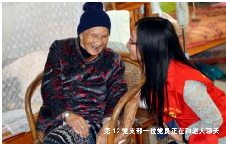
第12党支部一位党员正在和老人聊天