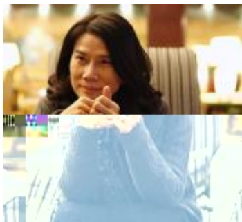
全国人大代表、格力电器董事长董明珠建议