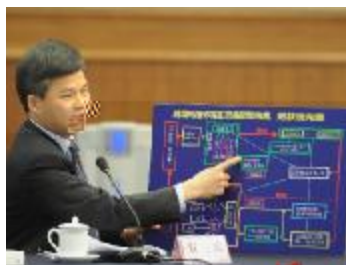
全国人大代表、格力电器副总裁

企业性质、人员规模、行业特点等因素，防止征缴政策一刀切； 2、根据实际适当确定残疾人就业保障金征缴标准； 3、国家机关及社会团体、事业单位应率先垂范，严格落实按比例安排残疾人就业规定； 4、实行残疾人就业保障金管理信息化，阳光操作，加强监督； 5、完善残疾人就业服务体系，扩大用人单位选择范围。