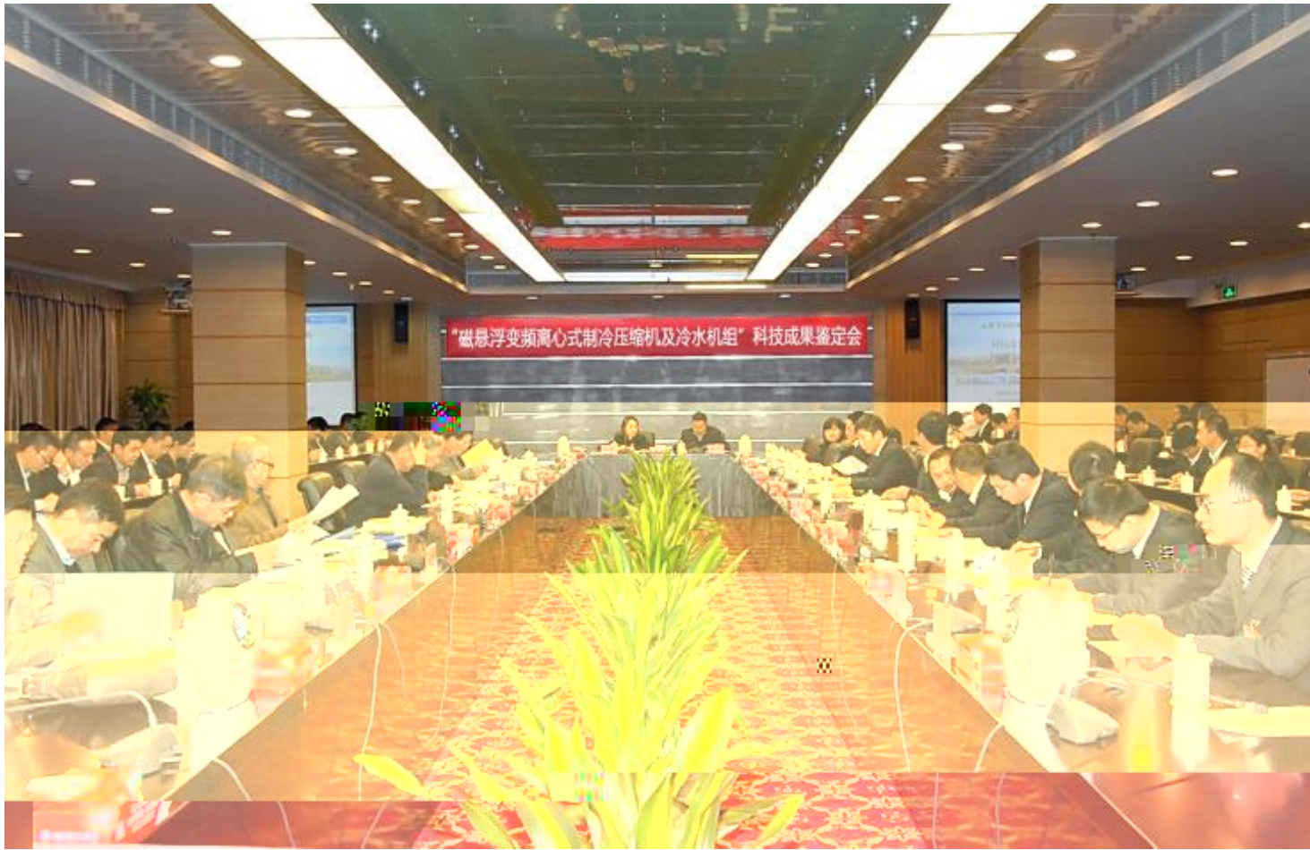
格力电器自主研发的“磁悬浮变频离心式制冷压缩机及冷水机组”在鉴定会现场被认定为“国际领先”。